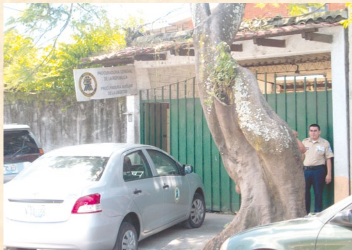
En la actualidad la Procuraduría de Santa Tecla se sitúa en 6ª Calle Oriente N° 5-4, colonia Utila.