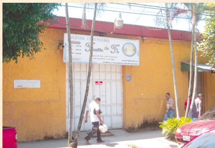
La primera oficina de Santa Tecla estuvo ubicada en 1ª Calle Poniente y 1ª Avenida Norte N° 2-2 local 9, ahora funciona en ese lugar una iglesia.

L a Procuraduría Auxiliar de este departamento tiene su sede en la ciudad de Santa Tecla, su cabecera departamental. Ejerce jurisdicción administrativa en los 22 municipios que componen la geografía, cuales son: Antiguo Cuscatlán, Chiltiupán, Ciudad Arce, Colón, Comasagua, Huizúcar, Jayaque, Jicalapa, La Libertad, Santa Tecla, Nuevo Cuscatlán, San Juan Opico, Quezaltepeque, Sacacoyo, San José Villanueva, San Matías, San Pablo Tacachico, Talnique, Tamanique, Teotepeque, Tepecoyo y Zaragoza. No obstante en lo judicial y según la Ley Orgánica de la Corte Suprema de Justicia, los municipios de Jayaque, Tepecoyo y Sacacoyo, pertenecen a la jurisdicción de Sonsonate.