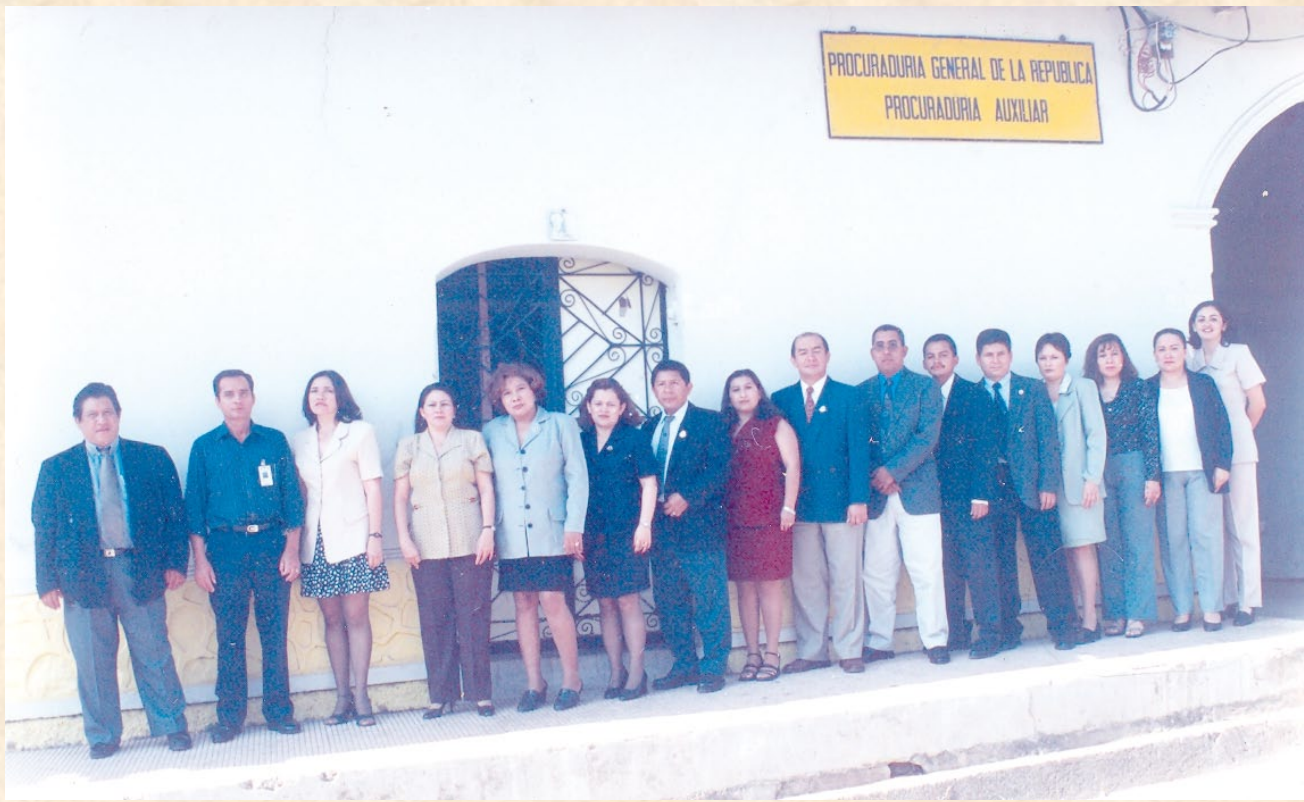
Desde 1998 esta Procuraduría Auxiliar se encuentra ubicada en Calle Dr. Jesús Velasco, Barrio El Calvario N° 17.