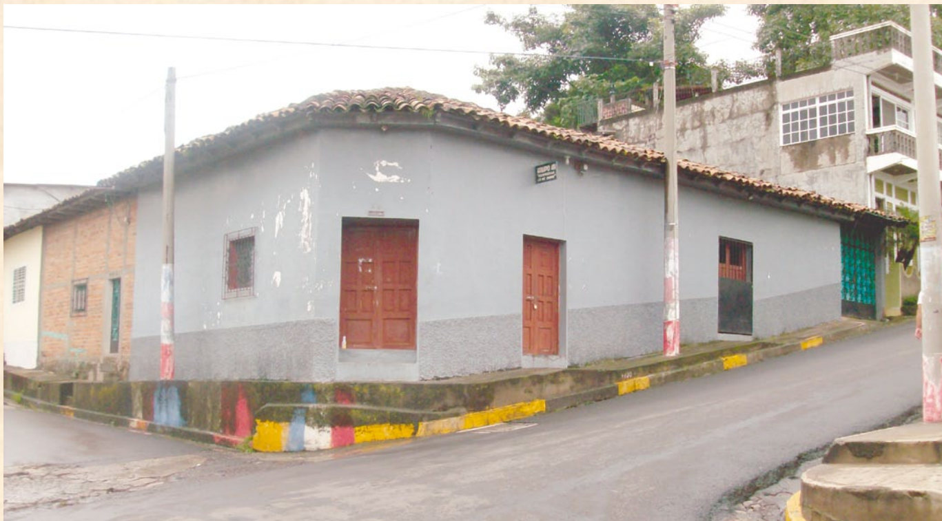
La primera oficina de la Procuraduría de Sensuntepeque estaba ubicada en 3ª Avenida Sur y 1ª Calle Poniente, Barrio San Antonio.

cuatro personas: el Secretario, la persona encargada de la cuota alimenticia, el ordenanza y yo. Cuando abrimos la Agencia yo tenía un escritorio ejecutivo y una máquina de escribir, también había dos archivos de cuatro gavetas. Como la casa era de esquina teníamos también dos bancas y el andén como era bien alto servía como banca para la gente que llegaba, parecía feria la Procuraduría, a mí me daba gusto ver todo bien concurrido. Recuerdo que al nomás abrir la Agencia llegaron como 300 casos y sólo dábamos asistencia en materia civil y laboral. Tuve el agrado de servirles a tantas madres cuyos maridos no se hacían cargo de ayudar a sus hijos; fue así como tuve el gusto de fijarles cuota alimenticia a todo el cuerpo de la extinta Policía Nacional de Sensuntepeque y ahí empezaron mis problemas con ellos porque me citaron y trataron de intimidarme diciéndome que ellos querían que les quitáramos las cuotas alimenticias que eran de 30 colones. En materia civil llevamos el caso de un señor que fue sacado de su casa por cinco hombres que se habían apoderado de su casa